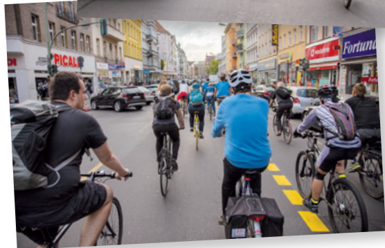
MitRADgelegenheit durch Neukölln