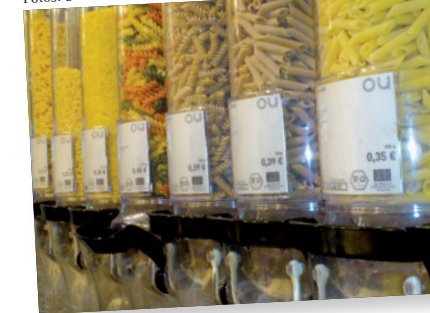
Pasta-Spender im Original Unverpackt, Einkäufe in eigenen Behältern